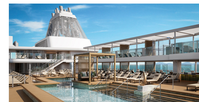
Open deck pool