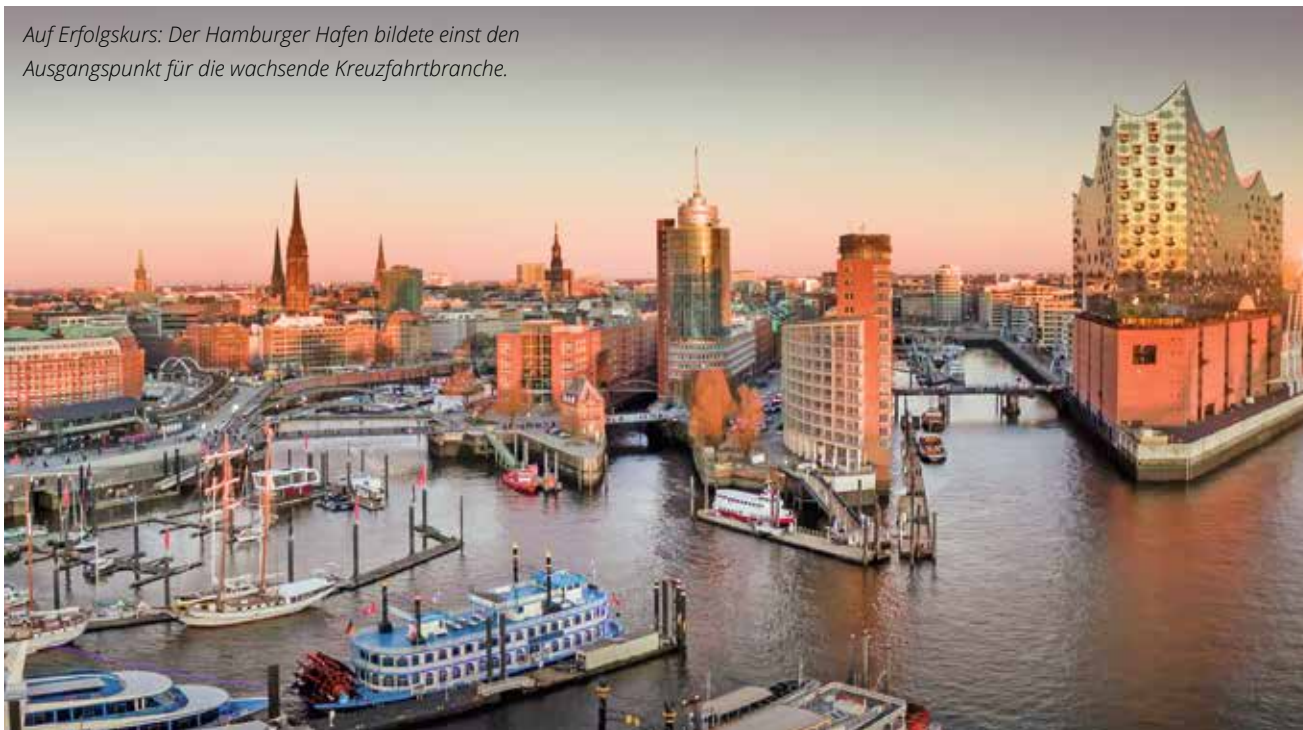
Auf Erfolgskurs: Der Hamburger Hafen bildete einst den Ausgangspunkt für die wachsende Kreuzfahrtbranche.

Gerade im Winter wollten nur wenige Menschen die gefährliche Reise über den Ozean antreten. So kam es zur Geburtsstunde der Kreuzfahrt und diese war ebenso wenig eine amerikanische Erfindung wie ein Geniestreich der Briten. Tatsächlich haben die Deutschen die Seereisen ins Leben gerufen – genauer gesagt, ein Reeder aus Hamburg: Albert Ballin von der Reederei Hamburg-Amerikanische Packetfahrt-Actien-Gesellschaft kam 1891 auf die Idee, ungenutzte Dampfschiffe für Fahrten im Mittelmeer einzusetzen.