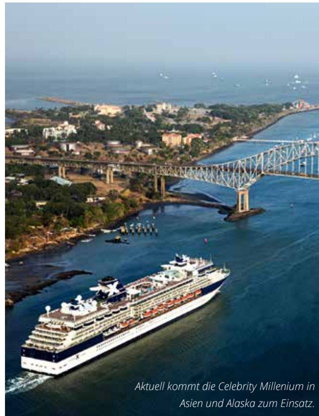
Aktuell kommt die Celebrity Millennium in Asien und Alaska zum Einsatz.

schon wesentlich kleiner aus. Stilsicherheit, kulinarischer Genuss und vor allem ausgefallene Reiseziele stehen hier im Fokus. Noch mehr Komfort und persönliche Atmosphäre finden Urlauber an Bord der Premiumschiffe von Azamara Club Cruises. Bei der Auswahl kommt jeder Gast auf seine Kosten.