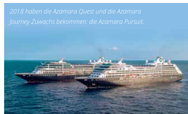
2018 haben die Azamara Quest und die Azamara Journey Zuwachs bekommen: die Azamara Pursuit.