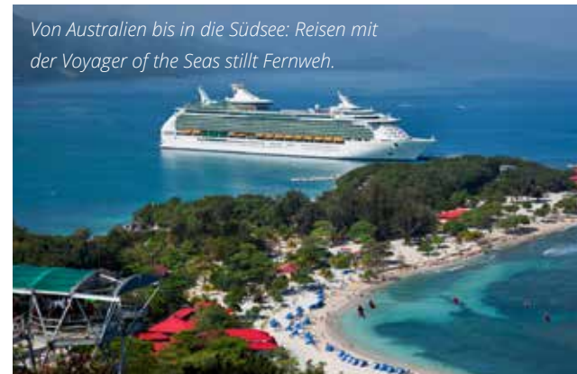
Von Australien bis in die Südsee: Reisen mit der Voyager of the Seas stillt Fernweh.