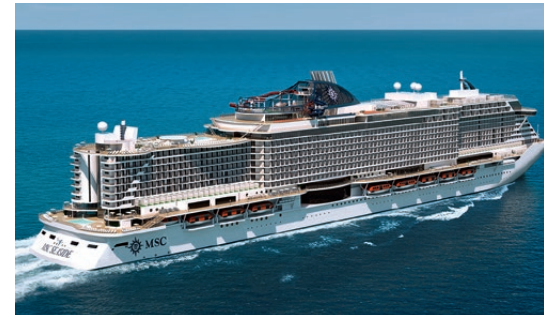
Im Mittelmeer und bei Transatlantik-Reisen wird die MSC Seaview anzutreffen sein, die im Juni 2018 in See sticht.