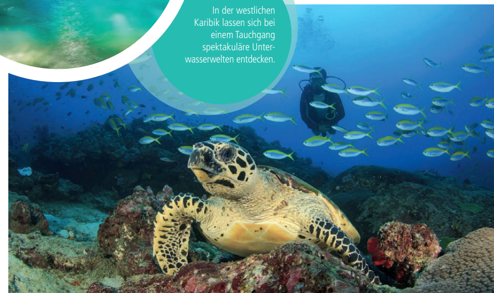
In der westlichen Karibik lassen sich bei einem Tauchgang spektakuläre Unterwasserwelten entdecken.