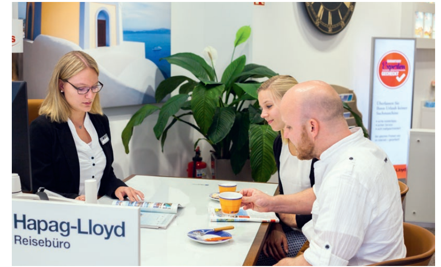
Die Reiseexperten von kreuzfahrtberater.de informieren Sie gern über die neuen Komplettpakete.

Wer in den Genuss eines solchen Angebots kommt, erhält alles aus einer Hand: die Anreise, die in der Regel mit dem Flugzeug erfolgt, beziehungsweise den Transfer vom Ankunftshafen, einen Aufenthalt in einem Luxushotel, ein abwechslungsreiches Programm vor Ort, das von einem persönlichen Reiseleiter begleitet wird, sowie den Transfer zum Abfahrtschiff oder die Heimreise. Je nach Reiseroute sind die angebotenen Komplettpakete ganz spezifisch gestaltet, um den Kunden alle Highlights der jeweiligen Region näherzubringen. Von einer zusätzlichen Übernachtung in der Hafenstadt am An- und Abreisetag mit ausgefallenen Sightseeing-Touren bis hin zu einer ganzen Woche Luxusurlaub an einem begehrten Reiseziel in der näheren Umgebung des Ankerplatzes reicht dabei das Spektrum. Die individuell abgestimmten Landpakete rund um das Kreuzfahrtsvergnügen können auch einen Großteil der Reise umfassen. So