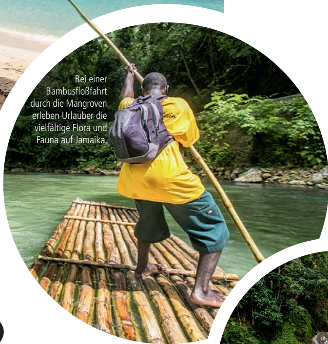
Bei einer Bambusfloßfahrt durch die Mangroven erleben Urlauber die vielfältige Flora und Fauna auf Jamaika.

liebte Urlaubsregion reist, der muss sich auf tropisches bis subtropisches Klima einstellen. Gleichmäßig sommerliches Wetter mit Temperaturen zwischen 25 und 32 Grad lädt das ganze Jahr hindurch zum Baden ein, die Wärme des Wassers reicht dabei fast an die