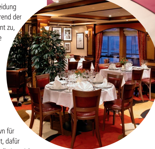
In Cagney's Steakhouse werden kulinarische Träume wahr.