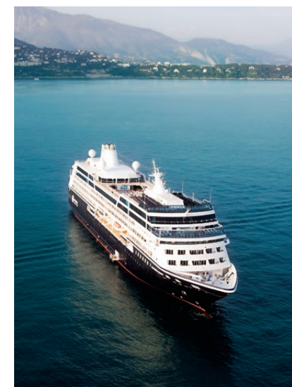
Auf einer Luxus-Kreuzfahrt im westlichen Mittelmeer können Passagiere attraktive Städte wie Monaco besichtigen.

Mitte nächsten Jahres wächst die Azamara Flotte von zwei auf drei Schiffe an: Zu den Schwesterschiffen Azamara Journey und Azamara Quest gesellt sich 2018 die Azamara Pursuit hinzu und vergrößert dadurch den Bestand um 50 Prozent. Das neueste Luxus-Kreuzfahrtschiff wird zunächst in Europa und dann in Südamerika zum Einsatz kommen. Im Zusammenhang mit der Flottenerweiterung erwarten wir einige schöne Sonderpreise, um die zusätzliche Kapazität an den Mann oder die Frau zu bringen. Für Sie als Stammkunden haben wir uns außerdem noch etwas Besonderes überlegt: Mit dem Gutscheincode AZA2018 erhalten Sie bei Buchung einer Kreuzfahrt mit Azamara Club Cruises bis zum 31. März 2018 einen zusätzlichen Bonus über 100 Euro je Kabine von uns. Wenn Sie sich im kommenden Jahr eine einmalig schöne Reise gönnen möchten, sollten Sie sich unbedingt die Kreuzfahrtrouten von Azamara Club Cruises anschauen. Unser Team berät Sie gern!