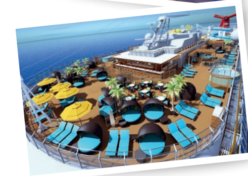
Als neues Flaggschiff folgt die Carnival Horizon ihrem Schwesterschiff Carnival Vista und wird ab April 2018 ihre Jungfernsaison in Europa starten. Neben aufregenden Destinationen überzeugt das Schiff mit einem exklusiven Interieur.

Auch im kommenden Jahr werden wieder Kreuzfahrtschiffe erstmalig in See stechen, nach aktuellem Stand 16 an der Zahl. So löst die Symphony of the Seas 2018 ihre Schwester Harmony of the Seas als größtes Kreuzfahrtschiff der Welt ab. Mit der Norwegian Bliss lässt Norwegian Cruise Line seine Passagiere ab 2018 Kreuzfahrten nach Alaska und in die Karibik erleben. Ein besonderer Aussichtspunkt an Bord ist die 180° Observation Lounge, die einen spektakulären Blick ermöglicht. Die Seabourn Ovation ist die neueste Luxusyacht der Seabourn Flotte und wird im Mai 2018 in Dienst gestellt. TUI Cruises bringt wenig später die neue Mein Schiff 1 – das gleichnamige alte Schiff verlässt hingegen die Flotte. Mit der MSC Seaview wird darüber hinaus die Seaside-Klasse von MSC Kreuzfahrten um ein zweites, bauglei-