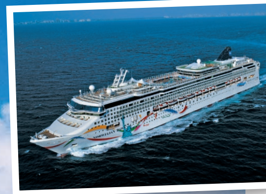
Maximal 2.340 Gäste können mit der Norwegian Dawn eine ganz besondere Kreuzfahrt erleben.