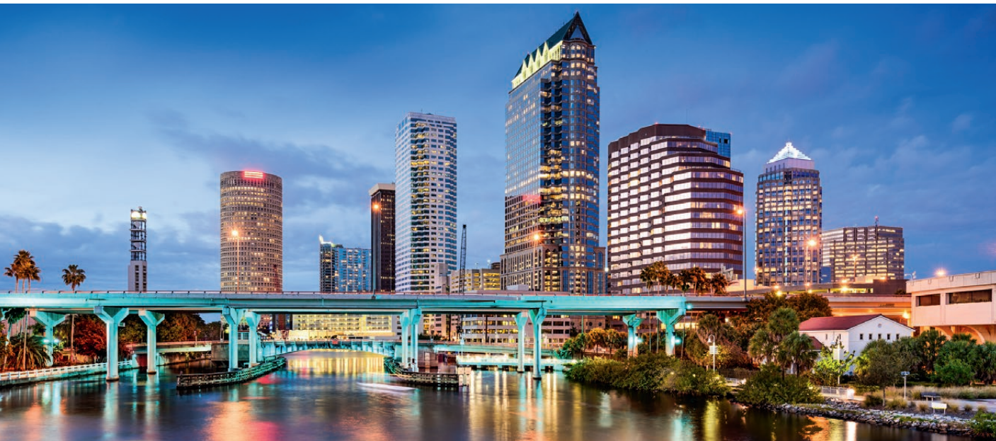
Tampa, die drittgrößte Stadt Floridas, ist Start und Ziel der 10-tägigen Reise.

Die Gegend um George Town ist für ihre ausgezeichneten Tauchmöglichkeiten berühmt, so sollte man sich als Wassersportler diese Gelegenheit, die örtliche Flora und Fauna unter Wasser oder auf Wunsch Schiffswracks kennenzulernen, nicht entgehen lassen. An einer Stingray City genannten Sandbank vor der Insel können Sie sogar wilde Stachelrochen berühren und füttern. Es folgt ein weiterer Seetag, bei dem Gäste ihre Erlebnisse an Land verarbeiten und an Bord entspannen können. Nächster Stopp ist Harvest Caye vor Belize, einem kleinen Land an der Küste Mittelamerikas, zu dem viele Inseln gehören. Belize überzeugt mit einem vielfältigen Ökosystem aus Urwäldern, Feuchtwäldern, Sümpfen und Korallenriffen. Darüber hinaus gibt es hier zahlreiche Zeugnisse der Maya-Kultur: Neben den Ruinen von Lamanai, die Sie mit einer rasanten Bootsfahrt über den New River erreichen, ist insbesondere der Tempel des Steinaltars in Altun Ha ein hochinteressantes Ziel. Um 17 Uhr heißt es wieder: Leinen los! Der nächste Halt liegt in Mexiko. An der Costa Maya können Gäste wieder alte Maya-Ruinen besichtigen oder an traumhaften Stränden entspannen. Außerdem lädt das zweitgrößte Riff der Welt zum Schnorcheln ein. Das Riff Banco Chinchorro liegt etwa 30 Kilometer