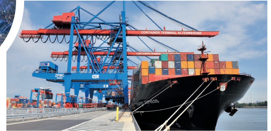
Mit einer Länge von 1.400 Metern gehört der Ballinkai im Hamburger Stadtteil Altenwerder zu den weltweit modernsten Containerterminals.