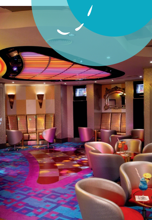
In der Dazzles Lounge & Nightclub können Gäste bei einem Drink den Tag ausklingen lassen.