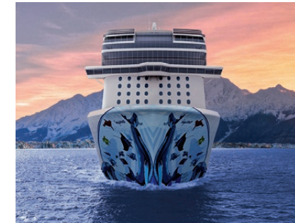
Alaska calling: Mit der Norwegian Bliss erkunden Besucher ab April 2018 das Polarmeer – vorbei an atemberaubenden Gletschern und hinein in ein unvergessliches Abenteuer.