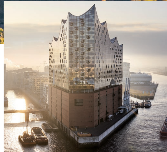
Imposant ragt die Elbphilharmonie in der Skyline des Hamburger Hafens als neues Wahrzeichen der Stadt hervor.

Einige würden ihn wohl als größte Sehenswürdigkeit der Stadt bezeichnen – aber der Hamburger Hafen ist weit mehr als eine Touristenattraktion. Wer den beliebten Anlegeplatz besucht, der lernt das Herz der Freien Hansestadt kennen. Mit zunehmendem Seehandel entwickelte sich auch die Stadt zu einer blühenden Metropole. Der Unternehmenssitz des Onlineportals kreuzfahrtberater.de in Ahrensburg liegt in unmittelbarer Nähe der norddeutschen Hafenstadt, die als Dreh- und Angelpunkt für spektakuläre Kreuzfahrten und Schiffsbesichtigungen dient.