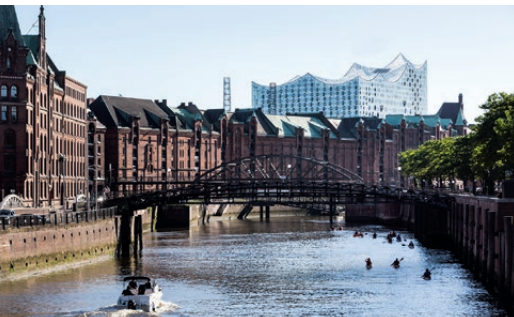
Als weltgrößter, historischer Lagerhauskomplex lässt sich die Speicherstadt im Hamburger Hafen zu Fuß oder bei einer Fleetfahrt erkunden.

Allerlei Genusswaren finden sich auch auf dem wöchentlich stattfindenden Hamburger Fischmarkt am Norderelbe-Ufer. Jeden Sonntag lockt der weltberühmte Wochenmarkt rund 70.000 Besucher an, die neben Fisch auch Obst, Gemüse und Topfpflanzen erwerben oder frühmorgens in der Markthalle zu Live-Musik tanzen können. Unmittelbar an den Hafen grenzt der berühmt-berüchtigte Stadtteil St. Pauli, den Schiffsreisende unbedingt erkunden sollten. Ob tagsüber oder bei Nacht, die Reeperbahn im Vergnügungsviertel lockt mit zahlreichen kleinen Kneipen und Bars und bietet abwechslungsreiches Entertainment. Ein optisches Highlight der neuen Hafenskyline bildet die Elbphilharmonie, die von den Hamburgern liebevoll „Elphi“ genannt wird. Die fast 800 Millionen Euro teure Konzerthalle wurde 2017 nach langer Bauverzögerung endlich eröffnet. Auf der kostenfreien Besucherterrasse mit Europas längster Rolltreppe bietet sich ein weiter Ausblick über die gesamte Hafenanlage. Ein Muss für alle Kulturinteressierten ist ein Gang durch die Speicherstadt, den weltgrößten historischen Lagerhauskomplex am Hamburger Hafen und zugleich UNESCO-Welterbe. Hier lässt sich ein Stück Hafengeschichte hautnah erleben. Ein besonderes Ereignis für alle Besucher und Einwohner der Stadt ist der jährlich zelebrierte Hamburger Hafengeburtstag. Ganze drei Tage lang geht die feierliche Zeremonie mit riesigem Feuerwerk sowie Schiffsparaden und einem einzigartigen Schlepperballett.