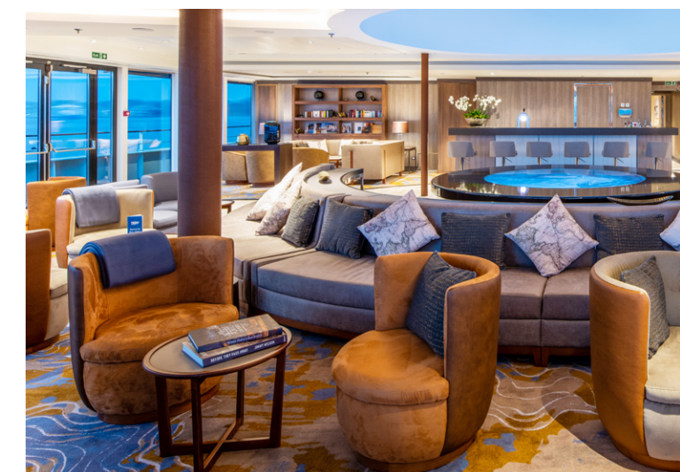
Observation Lounge der WORLD VOYAGER

mit schönster Architektur, in St. Petersburg lockt der Prunk der ehemaligen Zarenstadt, das gemütliche Helsinki sowie pulsierende, naturnahe Stockholm bilden die Reiseklassiker.