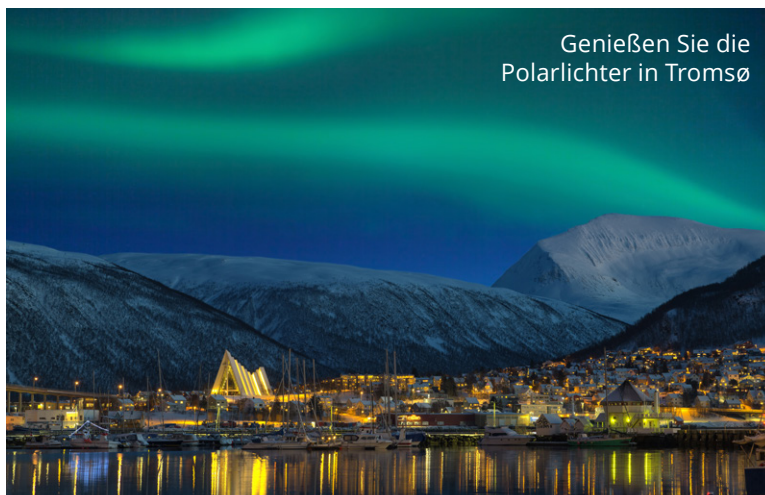
Genießen Sie die Polarlichter in Tromsø