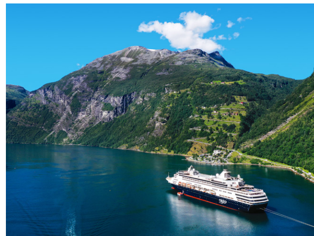
Die VASCO DA GAMA im Geiranger Fjord

wartet eine Kinderbetreuung. Das Schiff bietet ein bewährtes Hygienekonzept für sicheres Reisen, sodass Ihrem großartigen Urlaubserlebnis an Bord abseits des Massentourismus nichts mehr im Weg steht.